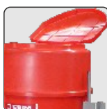
Tapa XL 150lts XL cover 150lts