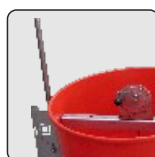
Tubos + largos Longer pipes