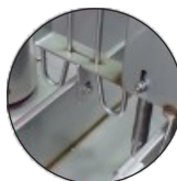
Sistema antipase Non crossing system