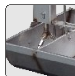
Kit doble chupete Double nipples kit