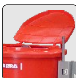
Tapa baja 100lts. Low cover 100lts