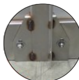
Sin aleta de fijación Without fastening feet