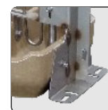
Aleta de sujeción Fastening feet