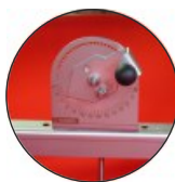
Graduador interior Inside controller