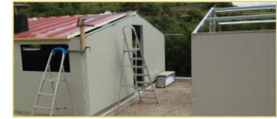
Montaje módulo de 5.60m. de ancho.