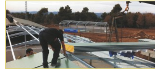
Montaje módulo de 8 m. de ancho