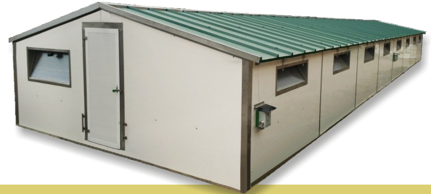
Mod. 5.60m. (tramos de 2.80m.)